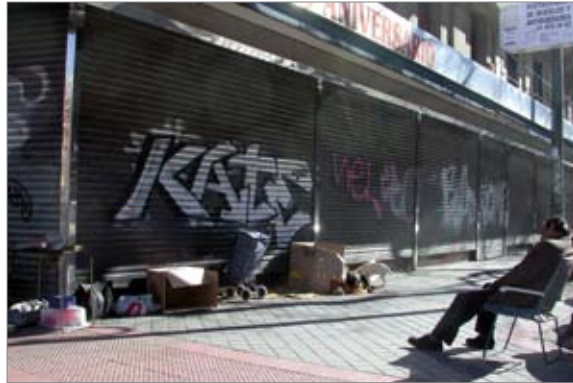
Imatge 2 Persona en situació de sense llar