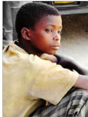
Imatge 4 Infants amb trets d'una altra cultura