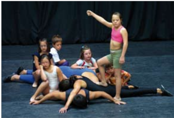
Imatge 3 Infant amb síndrome de Down