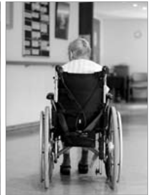
Imatge 5 Un avi en cadira de rodes