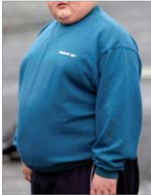
Imatge 1 Infant amb sobrepès